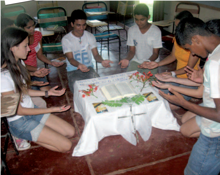
De ernst van het geloof in Brazilië: jonge missionarissen bereiden zich voor.