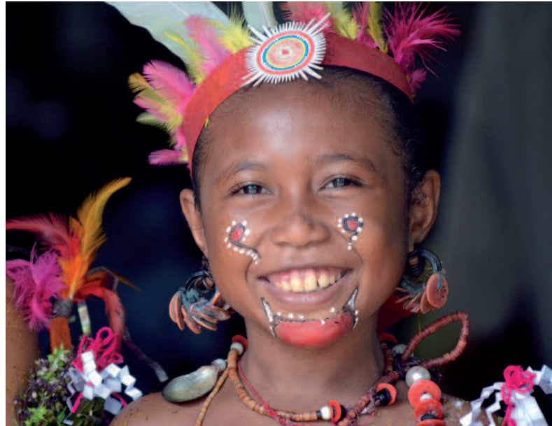
De vreugde van het geloof in Papoea-Nieuw-Guinea: inculturatie in alle kleuren.