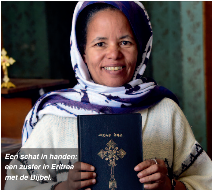
Een schat in handen: een zuster in Eritrea met de Bijbel.

Nr. 6 · Augustus/September 2017 Afgiftekantoor Leuven Masspost Verschijnt acht maal per jaar www.kerkinood.be