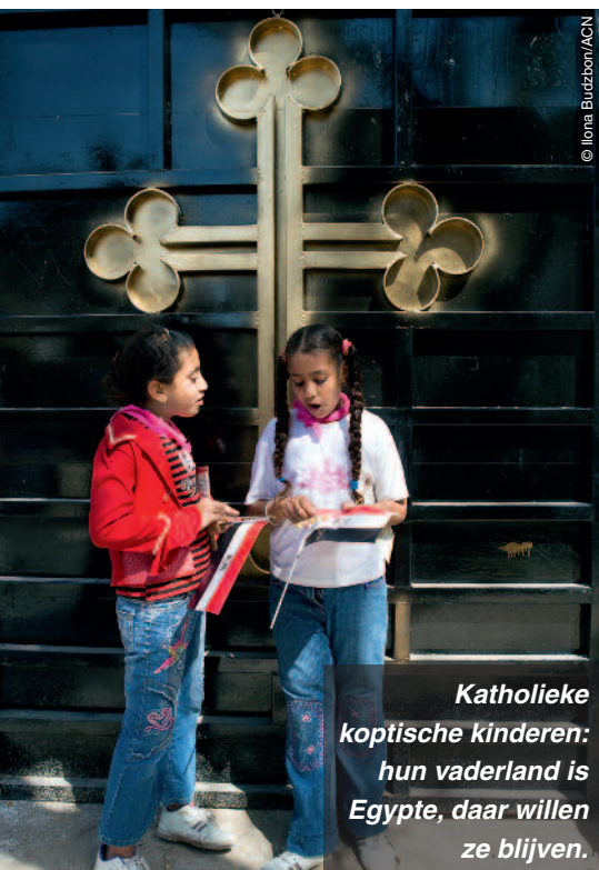
Katholieke koptische kinderen: hun vaderland is Egypte, daar willen ze blijven.

vensonderhoud te voorzien en als jonge orde hebben ze ook geen financiële reserves. Moeder Maria Verónica vraagt om bestaanshulp voor voedsel, kleding, water en stroom. En om een bijdrage voor de reis naar het moederhuis, zodat ze zich daar geestelijk opnieuw kunnen opladen. In totaal vraagt ze € 900 voor elk van de zusters voor het hele jaar. Opdat “de vreugde van het Evangelie de uiteinden der aarde bereikt en geen enkel randgebied verstoken is van zijn licht” (‘Evangelii gaudium’, 288), ook de periferie van Cuba niet. ●