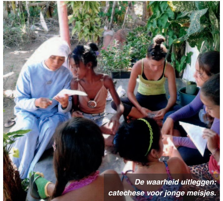
De waarheid uitleggen: catechese voor jonge meisjes.

“Jezus zelf was een man van de periferie, in Galilea, dat ver van de machtscentra van het Romeinse Rijk gelegen was. En toch luidde Zijn Woord het begin in van een spirituele en menselijke revolutie – de Blijde Boodschap. Die schat willen wij met anderen delen!”