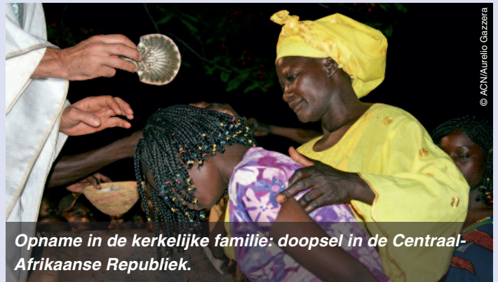
Opname in de kerkelijke familie: doopsel in de Centraal-Afrikaanse Republiek.

Voor paus Franciscus is het gezin een “meesterwerk van God”, dat zijn grondslag vindt in de natuur van de mens. Een goddelijk meesterwerk heeft helpers nodig die hun medewerking eraan verlenen. Dat verschilt van land tot land. Twee voorbeelden.