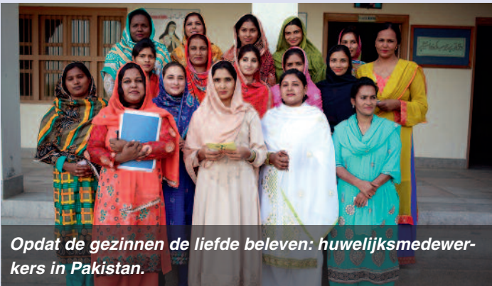
Opdat de gezinnen de liefde beleven: huwelijksmedewerkers in Pakistan.