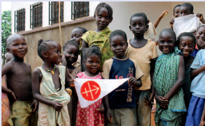
Uw toekomst is ook de onze: kinderen uit de Centraal-Afrikaanse Republiek danken u.

Het toenemende aantal hulpverzoeken uit Afrika weerspiegelt ook de groei van de Kerk in dit continent. Dit jaar ging het om 34 procent van alle aanvragen. Een bijzondere aandacht gaat uit naar de landen van het Sahelgebied, Noord-Nigeria, Kenia, Tanzania en Madagaskar – allemaal landen waar een agressieve vorm van de Islam zich aan het uitbreiden is. In het Midden-Oosten, waar de wieg van het Christendom staat, neemt de nood- en bestaanshulp een belangrijke plaats in. Ze verzekert de blijvende aanwezigheid van de Christenen in de regio. In Azië heeft de Kerk niet alleen hulp nodig in de landen die onder het communisme te lijden hadden of hebben – China, Vietnam, Laos – , maar neemt de nood ook toe in landen waar radicale vormen van het Hindoeïsme of de Islam de Christenen verdrukken en in een noodsituatie brengen, bijvoorbeeld in India en Pakistan en ook in delen van de Filippijnen. In Centraal- en Oost-Europa verplaatst de hulp zich van bouwprojecten naar basis- en voortgezette opleiding. In het middelpunt staan in dit deel van de wereld vooral de Balkanlanden, waar eveneens radicale vormen van de Islam de Christenen het leven lastig maken. Onze solidariteit helpt de Christenen ook daar om standvastig te blijven in hun geloof.